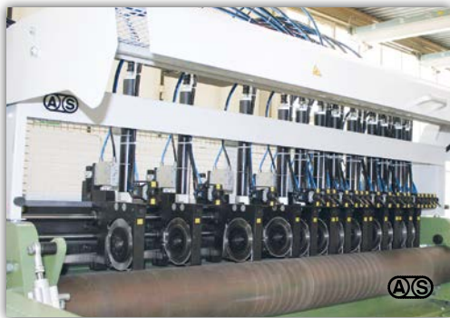
Pneumatischer Messerhalter Typ PK-30-P zur Bedienung auf der Wickelseite