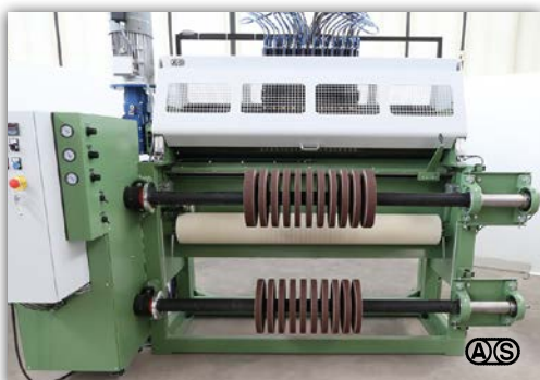
Bis zu 20 Schnitte gleichzeitig