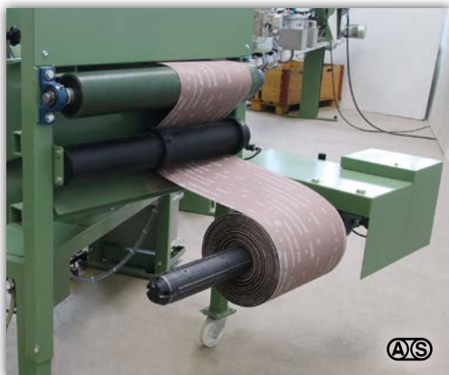
Abrollstation für Rollen bis \varnothing 700 mm und einer Breite bis 610 mm