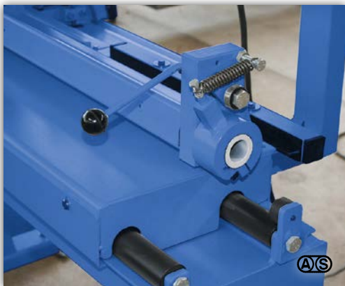
Klemmvorrichtung auf verfahrbarem Tisch