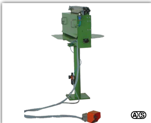
Pneumatische Schneidmaschine Typ HQP

L mit Bedienseite links, R mit Bedienseite rechts. Links und rechts bezieht sich auf die Laufrichtung des ablaufenden Bandes.