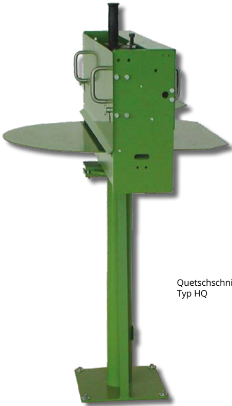
Quetschschnitt Schneidmaschine Typ HQ

Die Maschine des Typs HQ ist eine einfache Maschine für das Ablängen von Zuschnitten bei der Herstellung von flexiblen und beschichteten Schleifmitteln. Die Schneidmaschine ist auch als pneumatische Ausführung Typ HQP erhältlich (Schnitt wird pneumatisch ausgeführt). Die Maschine arbeitet mit einem Quetschschnittsystem welches sowohl gerade Schnitte wie auch Wellenschnitte erlaubt.