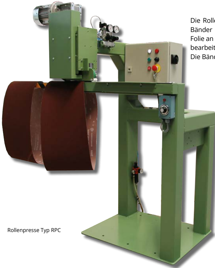
Rollenpresse Typ RPC

Die Rollenpresse Typ RPC ist eine kontinuierlich arbeitende Presse, welche viele Bänder in sehr kurzer Zeit pressen kann. Es können Bänder, welche bereits die Folie an einem Lappenende aufgetragen haben (z.B. vorbereitet durch die Lappenbearbeitungsmaschine Typ 494) als auch Überlappverbindungen gepresst werden. Die Bänder werden in beiden Fällen auf der Presse gefügt.